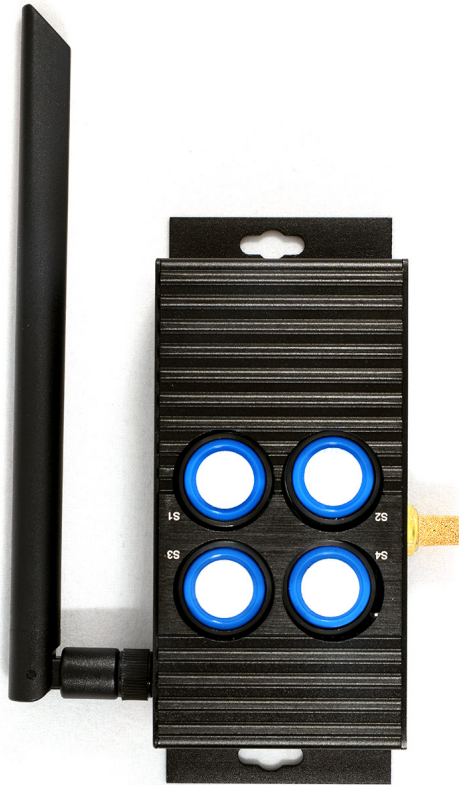
Versiunea hardware HW 107

Temperatură, umiditate relativă, compuși organici volatili (COV), particule PM1, PM2.5, PM10, ozon O3, monoxid de carbon CO, dioxid de azot NO2, dioxid de sulf SO2, nivel de zgomot