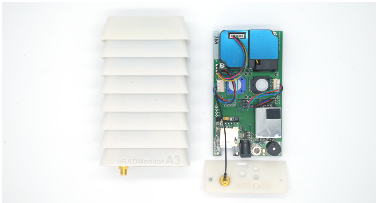
Noul scut Stevenson de rasina alba pentru uRADMonitor A3

Aparatele se pot utiliza la exterior. uRADMonitor A3 vine în două variante, cu carcasa de aluminiu pentru interior care are nevoie de protecție suplimentară la ploaie sau cu o carcasa de rășină de tip Stevenson care permite utilizare la exterior. Va rugăm indicați necesitățile Dvs. pentru a vă putea servi în mod util. Carcasele Stevenson se pot prinde cu bride de plastic sau cu coliere metalice.